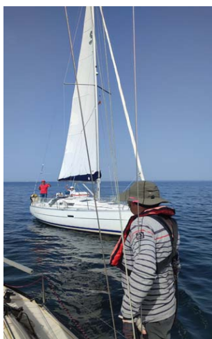
Improbable rencontre entre Tudyne et Paprika au milieu de nulle part

Décidément cette année les croisières de l' APLOC n'arrivent pas jusqu'à Port Joinville en Yeu.