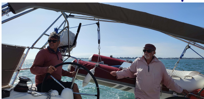
Le skipper de Lidawen, en tête du trophée, à la barre