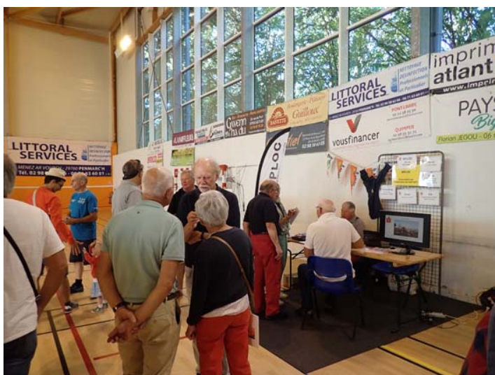
Affluence au stand de l' APLOC

Comme chaque année l' APLOC participe au forum des associations, c'est l'occasion de rencontrer nos adhérents et de faire connaître nos actions à un plus large public. Cette édition a été marquée par une importante fréquentation tout au long de la matinée.