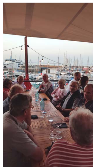
La croisière à Groix