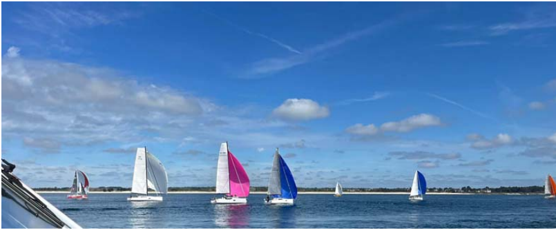
Les POGOS en route vers la basse rousse