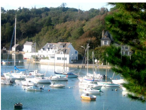
Le port du Bélon