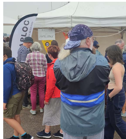
Affluence sur le stand de l' APLOC