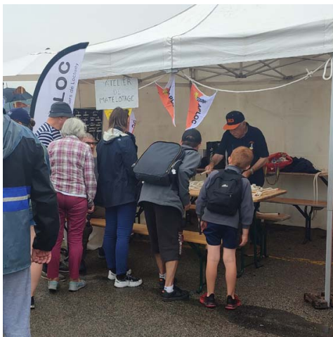
Maître Jacques a toujours autant de succès