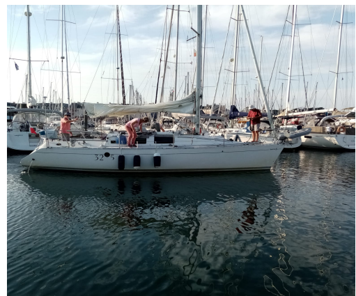
Bérénice au Palais plein comme un œuf en cette fin août