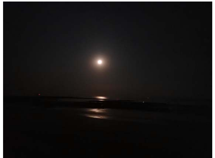
À défaut d' étoiles filantes un superbe clair de lune

Jazz in Loc ne devrait pas programmer Gershwin le soir de notre pique-nique... nous étions cependant quelques uns à avoir réussi à concilier les deux.