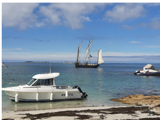
Le Corentin au loin

Le pique nique d'août, reporté pour cause de brouillard au mercredi 24, a réuni cinq bateaux à moteur. Les voiliers, pour la plupart, étaient déjà partis en croisière.