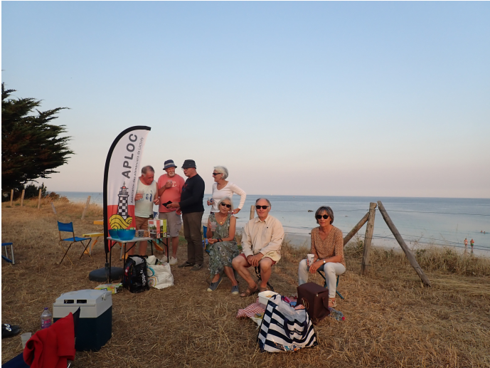
Les participants au pique nique