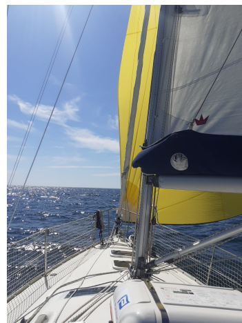
Tudyne en route pour Yeu

Cinq bateaux ont participé à la croisière sud. Après un début de croisière dans une brume épaisse, nous avons profité du soleil et de vents souvent faibles et tournants qui nous ont cependant permis d'envoyer le spi tous les jours pour les plus chanceux .