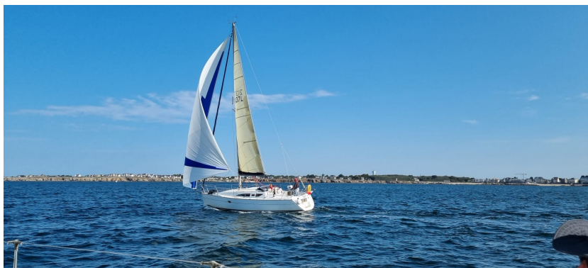
Shamal au large du Croisic