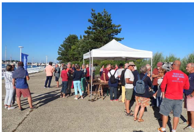
Les participants au pot d' août

Le pot du 19 août a réuni une cinquantaine de membres , ainsi que quelques plaisanciers en escale. Ce pot a permis la mise au point du programme de la croisière sud