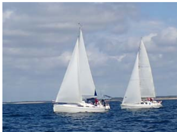
Mataiva et Berenice en route pour Groix