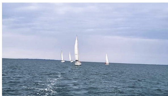
La flottille groupée pour franchir la barre d' Etel sous les directives du pilote du sémaphore