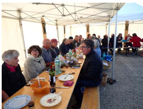
Les mangeurs de poisson

Une quarantaine de membres a participé au barbecue concluant la journée de pêche aux Maquereaux du 12 mai .