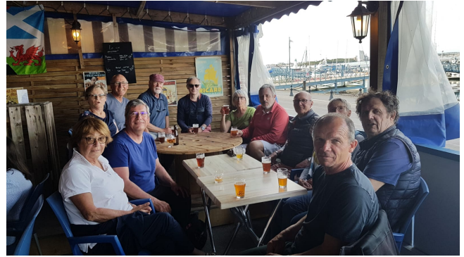
La croisière se désaltère

Cinq bateaux ont participé à la croisière cabotage vers Etel . Après un regroupement à Port Louis, la flottille s' est présentée groupée devant la barre, franchie sous les directives du pilote au sémaphore. Une étape à Groix avant le retour agité sur Loctudy . Ce fut l' occasion pour plusieurs participants d' un premier franchissement de la barre d' Etel.