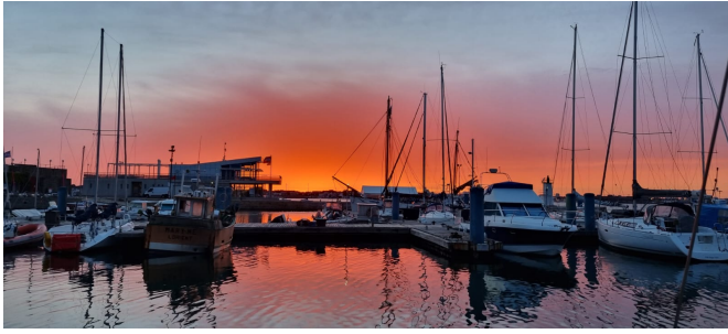
coucher de soleil à Port Louis