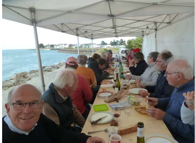
Les participants cuvée 2019