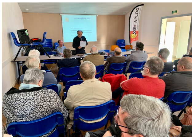
Présentation des activités