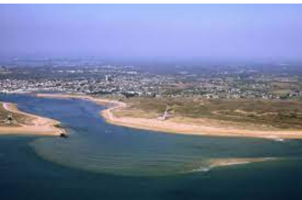
L'entrée de la rivière d' Etel

Une sortie cabotage vers Etel est prévue du 21 au 26 mai,