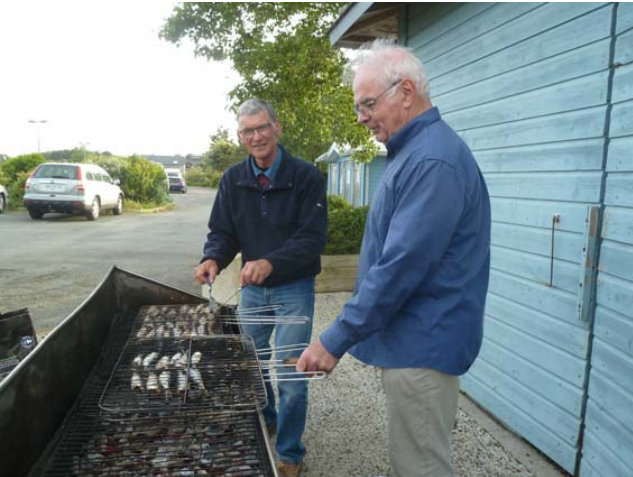
La cuisson des.....sardines