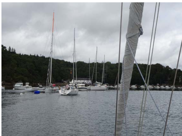
Arrivée au Bélon juste avant un « joli » grain