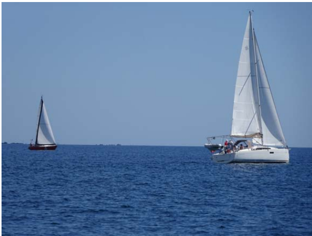
Lidawen au premier plan au loin Lorca