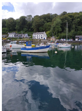
Le port du Bélon toujours aussi « paysage de carte postale »