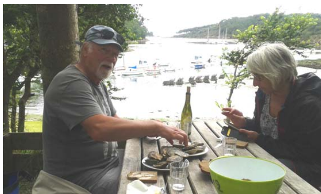
Un réconfort bien mérité après le passage du grain