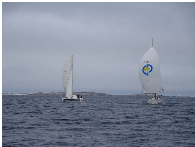
Bérénice sous spi