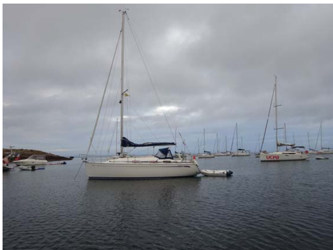
Picabulle le 13 juillet aux Glénan