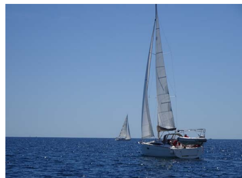
Lidawen au loin Berenice