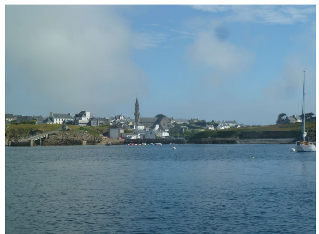
Mouillage à Lampaul