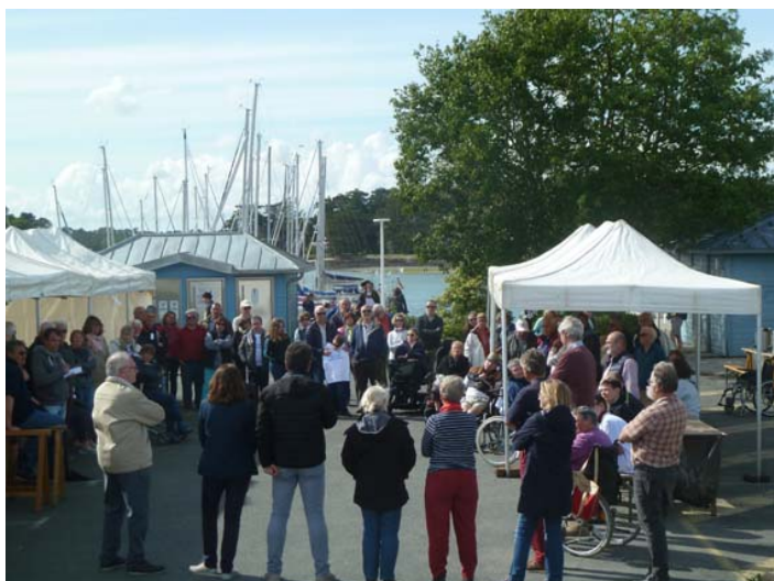
Les participants à l'écoute des élus