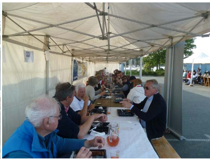
Organisateurs et participants terminent la journée Par un repas convivial