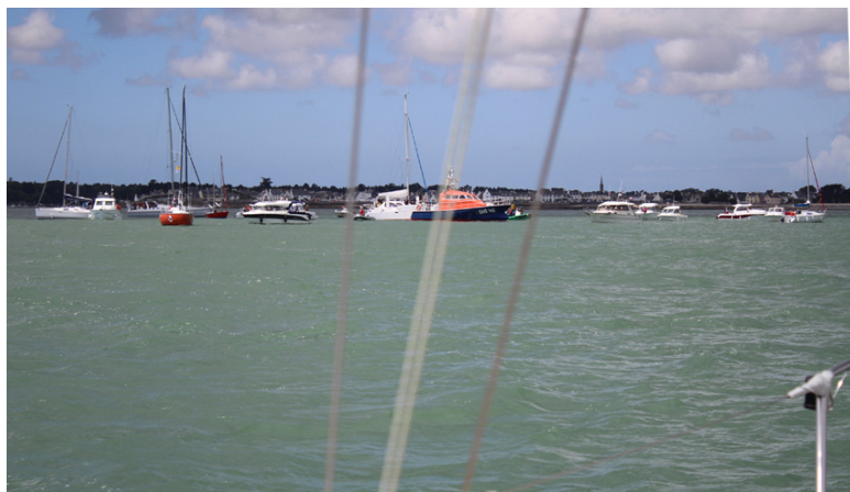
Autour de Margodig pour l'hommage aux disparus des Sables d'Olonne

Une « fenêtre météo inespérée » et la mobilisation de nombreux bénévoles ont permis le succès de l'édition 2019 de tous en mer. Bravo et merci au groupe de travail qui organise cette manifestation.