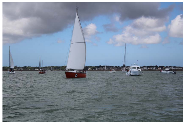
Départ pour Benodet