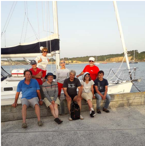
Les croisiéristes à Camaret