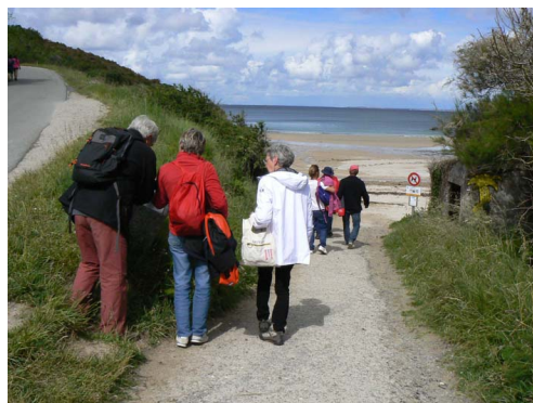
Randonnée à Belle Ile