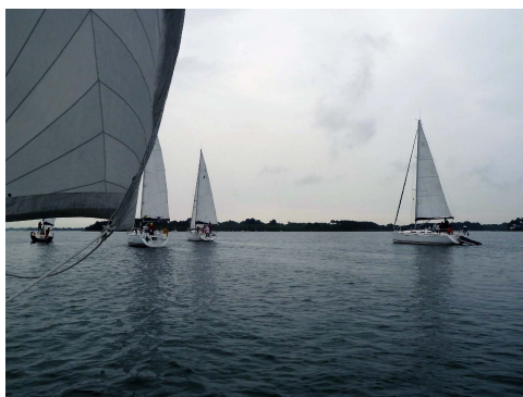
La flottille dans le Golfe