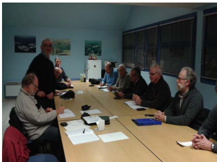
Réunion du Conseil d'Administration