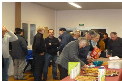
Le pot de l'amitié agrémenté des sucrés salés préparé par les membres du Conseil d'Administration