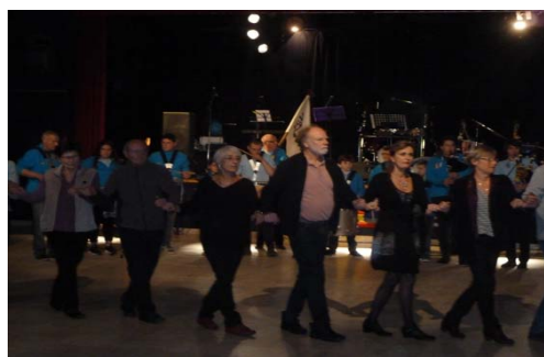
L' after au Fest noz organisé par le bagad de Loctudy