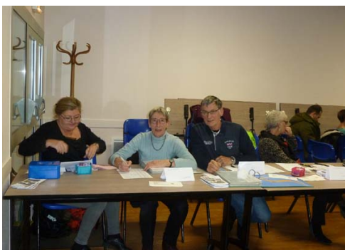
Accueil, émargement, renouvellement des adhésions et délivrance des cartes .

L'assemblée générale s'est clôturée par l'intervention de madame la Maire de Loctudy et le traditionnel verre de l'amitié.