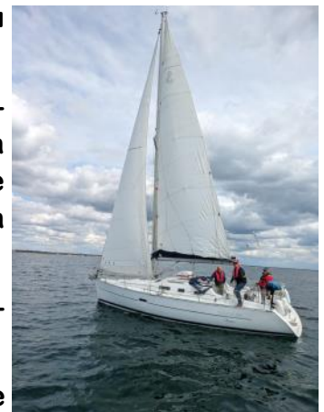
On règle pour éviter le dépassement