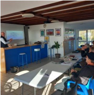
C'est la terre qui tourne...

Ils étaient une bonne demi-douzaine à vouloir percer les mystères des astres et le miracle des mathématiques.