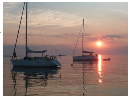
Soleil couchant au mouillage

Dans le cadre de son programme d'activité d'été, la commission voile vous propose sa première croisière vers Etel. Petit cabotage côtier en flottille, balades en escale, petits restaurants et échanges amicaux et maritimes seront au rendez-vous.