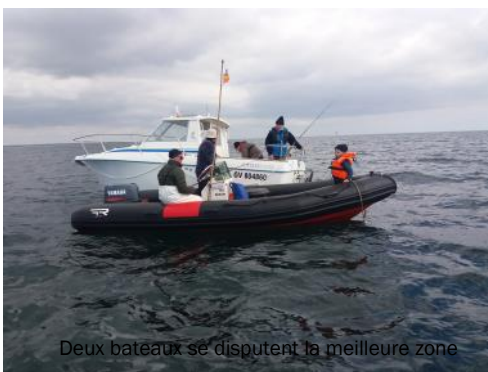
Deux bateaux se disputent la meilleure zone

Les prises furent moins nombreuses que les 10 pêcheurs qui participaient à cette première partie de pêche en bateau de cette année.