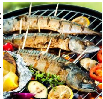
La pêche espérée

Ne pas oublier vos couverts, verres , boissons et pain.