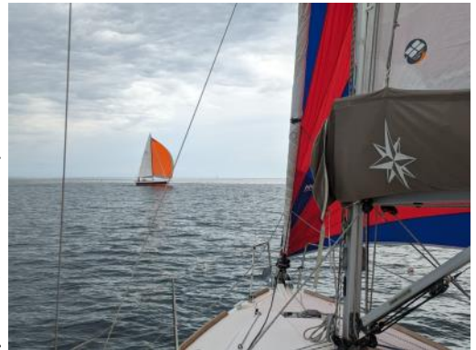
L'Aventure vue de Lidawen...Une affaire de famille