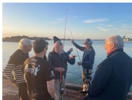
Les explications du maître....