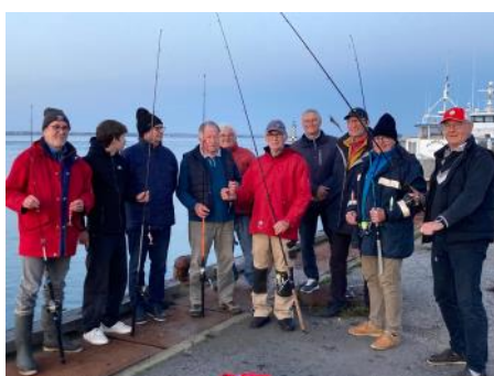
Une équipe fière de son score....