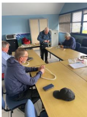
Ambiance studieuse et appliquée....