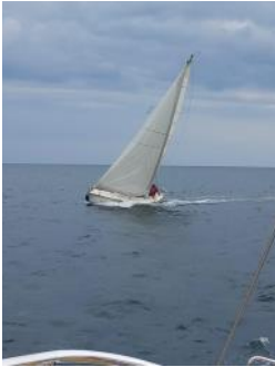
Paprika au combat....

Un vent fripon ne sachant d'où venir, parsemé de molles, un vrai match-play entre des équipages essayant tout pour faire avancer leur bateau.