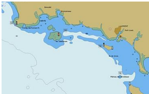
Le terrain de jeux ....