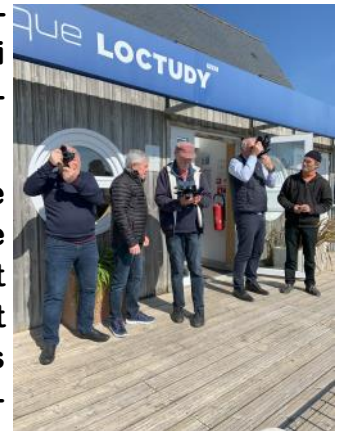
Le soleil est au 162...