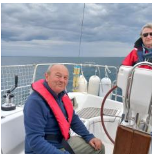
Plaisirs de l'équipage