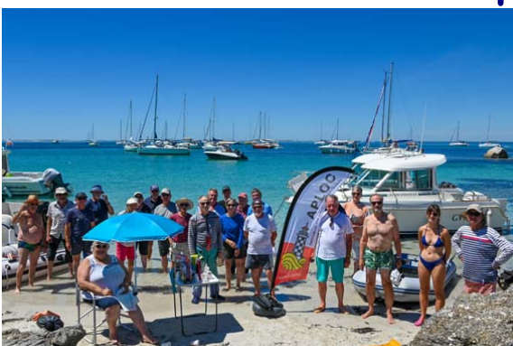
Les participants de l'an dernier

Nous nous retrouverons le lundi 10 juillet pour notre pique-nique à Penfret rivage est ou ouest en fonction du vent.