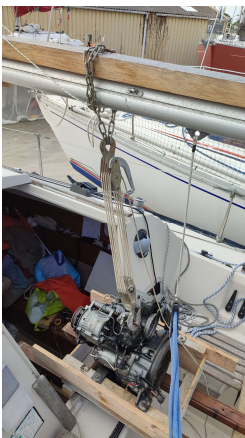
La sortie du moteur H.S. de Paprika