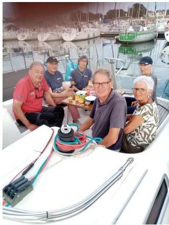
Retrouvailles des équipages de Birinik et Paprika à Port Louis