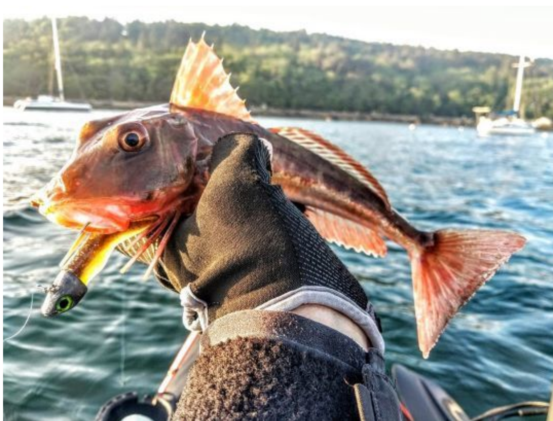
Le Grondin pêché à la palangre

La sortie « pêche à la palangre » qui visait les dorades a réuni quatre bateaux, une belle météo, mais comme souvent les dorades n'étaient pas au rendez-vous. Seul un joli grondin a mordu. Une belle journée malgré la houle qui a quelque peu indisposé les pêcheurs...heureusement le pot de l'amitié a permis de remettre les estomacs en place.