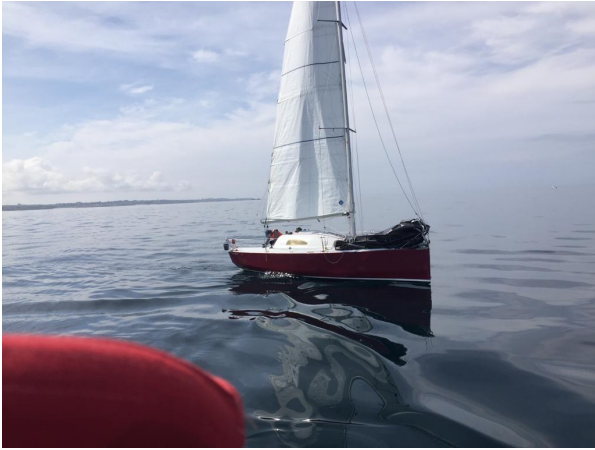
Grand cru vu de Taga dans le calme en route vers l' Aber Wrach'