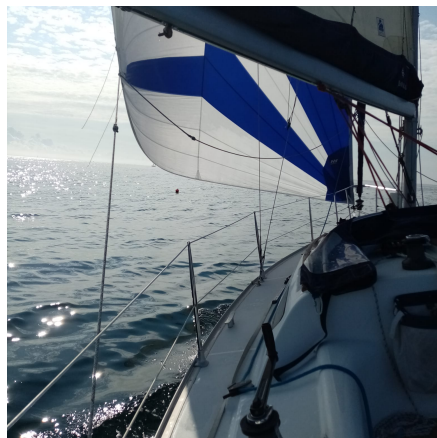
Shamal au départ de Loctudy