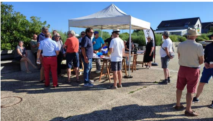
Le pot de l'an dernier

Comme chaque année, nous organisons un pot en juillet, l'occasion de rencontrer nos adhérents vacanciers et d'accueillir les nouveaux autour d'un verre que nous partageons avec les navigateurs en escale à Loctudy.