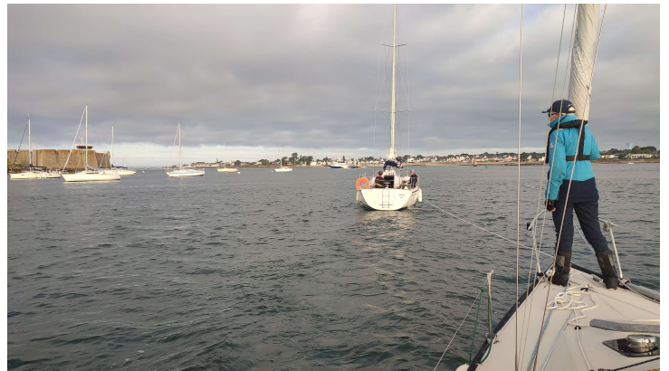
Birinik remorque par Paprika suite à sa casse moteur