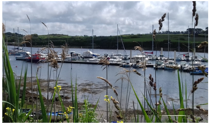
Taga et Grand cru à l' Aber lldut