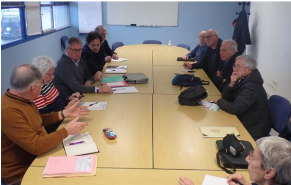
Le groupe de travail à l'ouvrage

Lors de la seconde réunion du groupe de travail, à la suite des retours des inscriptions, il a été décidé de :