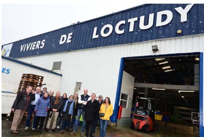
Le groupe à l'issue de la visite

La visite des Viviers a été l'occasion pour une quinzaine de membres de l'APLOC de découvrir un aspect de la vie économique de Loctudy.