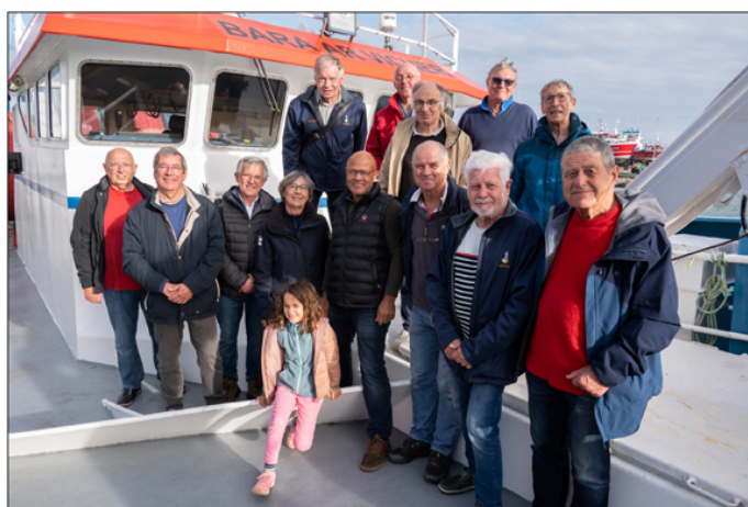
Le groupe à l'issue de la visite

source et d'économies d'énergie. Ses réponses à toutes nos questions ont suscité un grand intérêt parmi tous les participants, de prendre conscience des problèmes de la pêche ainsi que des défis à relever pour l'avenir.