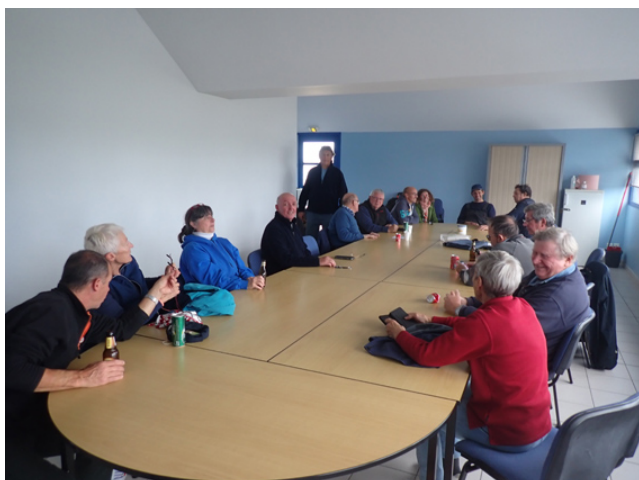
Debriefing et pot de l'amitié après la sortie

Les sorties du samedi après-midi support du trophée de la baie rencontrent un vif succès tant auprès des skippers que des équipiers. En effet malgré la saison qui s'avance encore huit bateaux et une vingtaine d'équipiers participent chaque samedi.