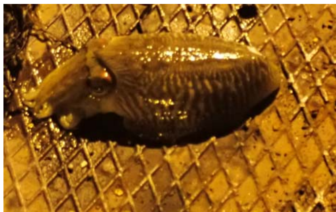
Une jolie seiche prise ce soir

Quai nord la dizaine de pêcheurs réunis pour les encornets, n'a pas été déçue en effet seiches et encornets étaient au rendez-vous.