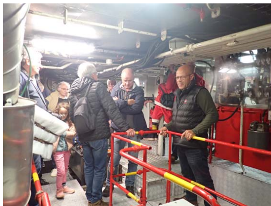
La salle des machines