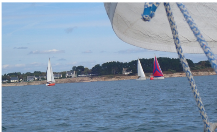
Au coude à coude à Basse Rousse