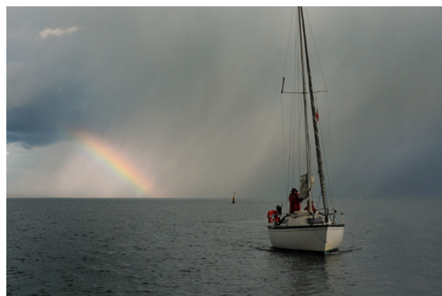
Le ciel n'est pas toujours bleu...