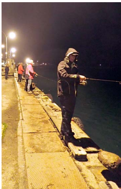
Une partie des pêcheurs en action