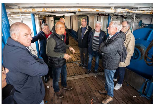
Visite du pont de travail