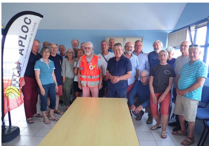
Une partie des récipiendaires avec leur formateur

A l'issue des trois formations « initiations aux premiers secours » la remise des diplômes a été l'occasion d'une rencontre entre les participants aux différentes sessions.