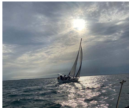
Mataiva dans la brise