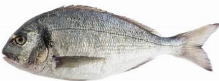
Sursit pour les dorades

Nous avons joué de malchance avec les deux séances de pêche programmées, les conditions météo défavorables, n'ont pas permis de sortir en mer. Ce n'est que partie remise