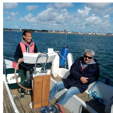
La pilote et l'équipier de Shamal