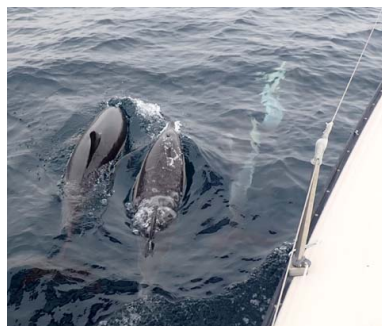
Jolie rencontre pour Paprika