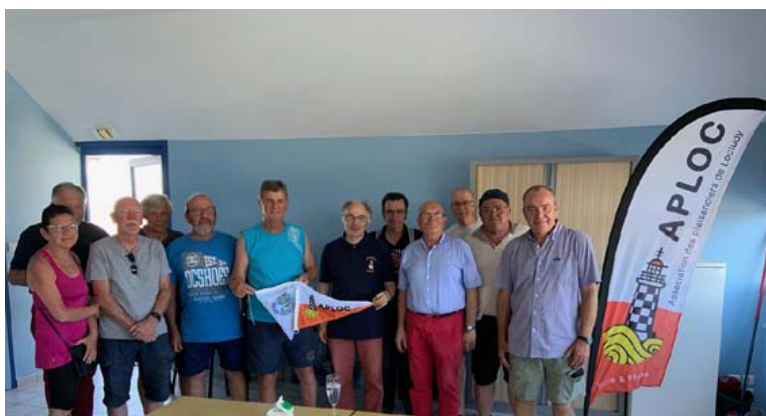
Échange des fanions des associations

A l'occasion de leur croisière en flottille les Pêcheurs Plaisanciers d'Hennebont ont fait escale à Loctudy.