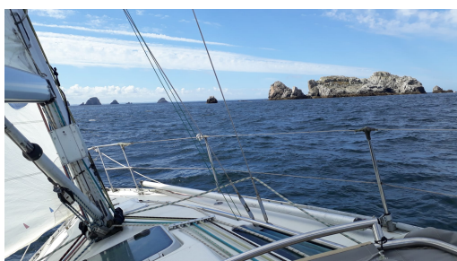
Bérénice au Toulinguet