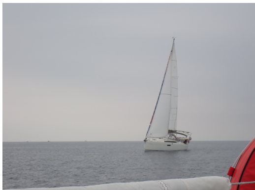
Lidawen à Groix