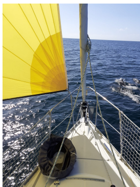
Tudyne et les dauphins

Nous n'avons pas réussi à organiser une « grosse flottille » mais entre le 15 juin et le début juillet, souvent par groupe de deux, Tudyne, Divine, Bérénice, Mataiva, Shamal, Grand Cru, Lidawen, Paprika, ont croisé entre l' Aber Wrac'h et les Sables D'olonne.