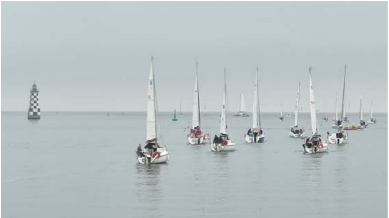
Les Djinns dans le chenal, en tête de la flotte le bateau accompagnateur