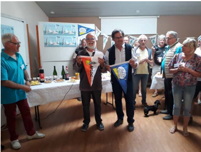
Échange de fanions entre les présidents

Nous avons participé au rassemblement de l'Association des Propriétaires de Blue Djinn (6.09m) et Djinn7 (7.06m), dériveurs intégraux habitables.