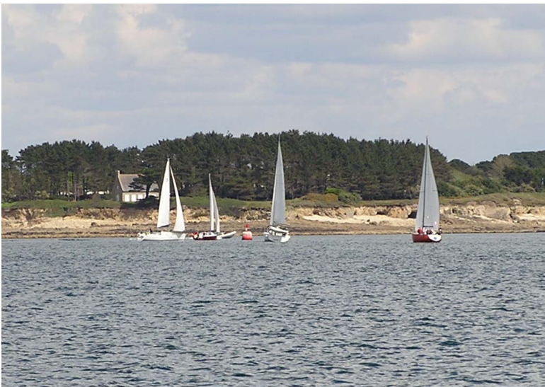
Le passage à Basse Rousse

Rendez-vous les samedis à 13h45 devant la capitainerie.