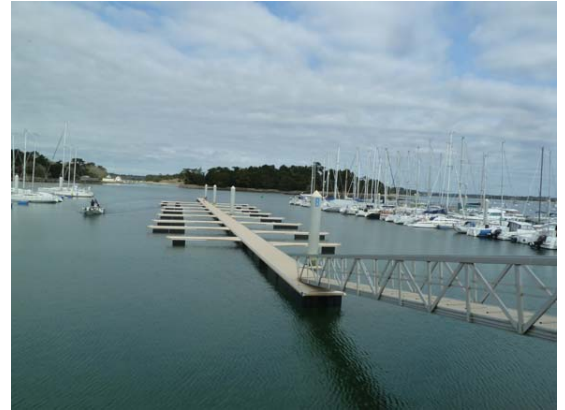
Le ponton B mis en cours de finition