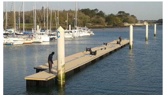
Mise en place du ponton C

Le remplacement des pontons est en cours, il reste les raccordements aux réseaux à effectuer. Certains plaisanciers ont différé la remise à l'eau de leur bateau pour faciliter les travaux.