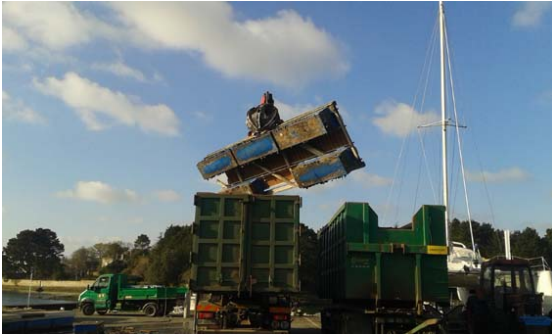
Les pontons usagés mis en décharge