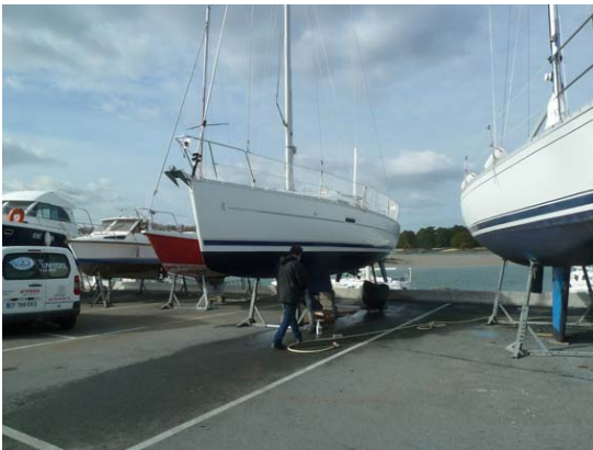
Du polish pour Tudyne