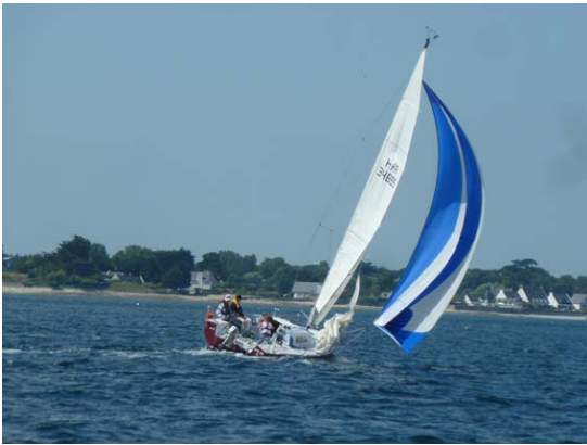
Grand Cru la saison dernière