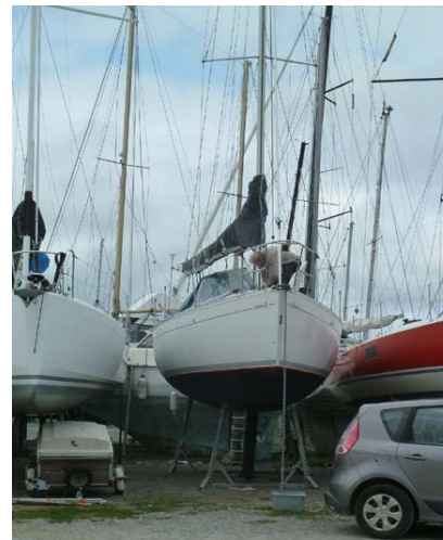
Sur Bérénice on vérifie le mouillage pour les prochaines croisières

Les sorties du samedi redémarrent , seul « Grand Cru » a bravé la bise ce samedi 3 avril les autres habitués du samedi n'ont pas encore terminé leur réarmement .