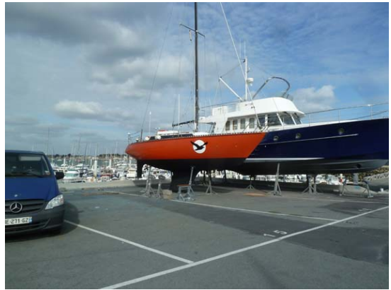
Lorca au carénage