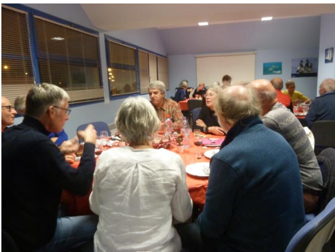
Les membres de l'APLOC réunis, lors d'une soirée conviviale pour partager le ragoût de chou de la SNSM