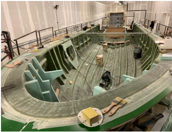
Une coque en stratification

constructeur ( basé à Quimper au bord de l'Odet )de bateau ultra-rapides, en résines, bateau d'intervention de la gendarmerie, de l'armée française ou des armées étrangères