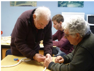
Maître Jacques à l'oeuvre