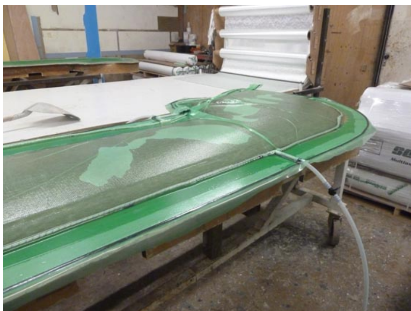
La quille en phase « d'infusion ».

Nous avons pu voir un des premiers exemplaires des nouveaux « mini transat » conçus pour naviguer sur foils.