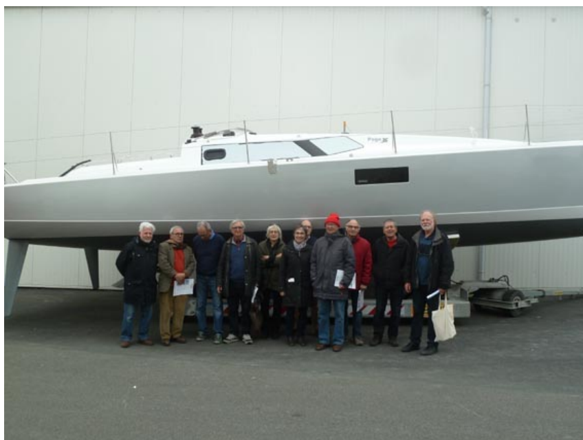
Notre groupe devant un pogo 36