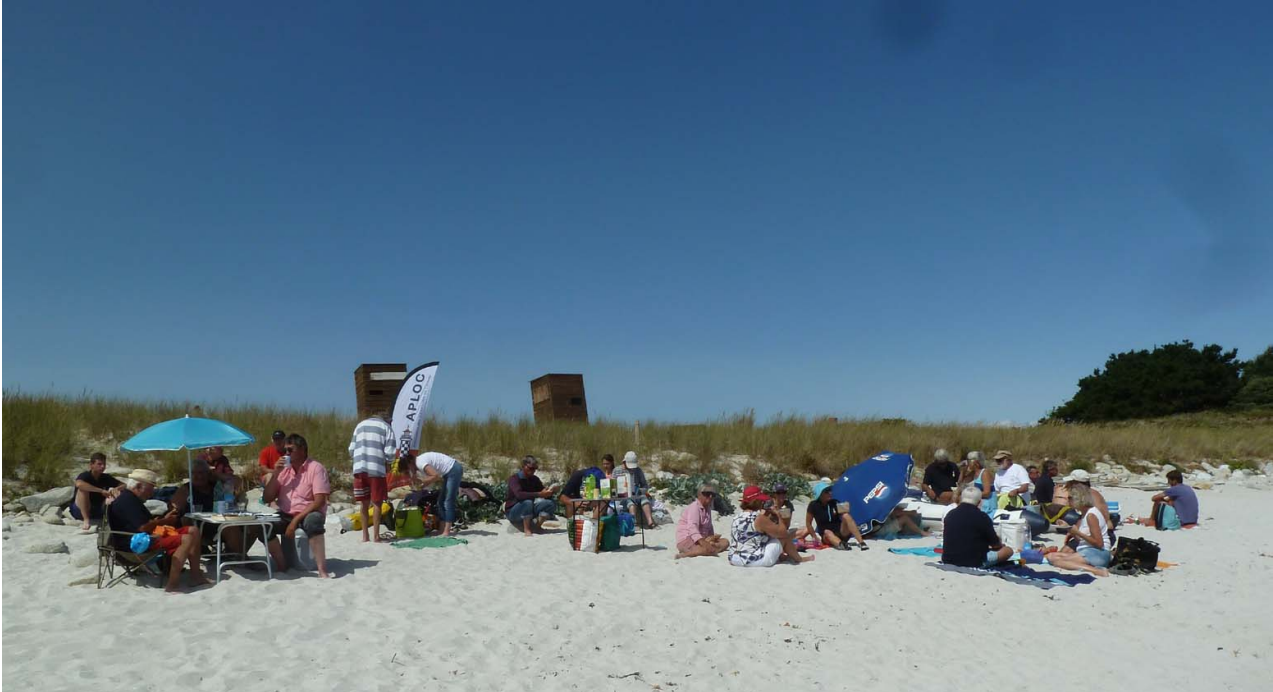
La plage de Penfret sous un grand soleil, rien que pour nous