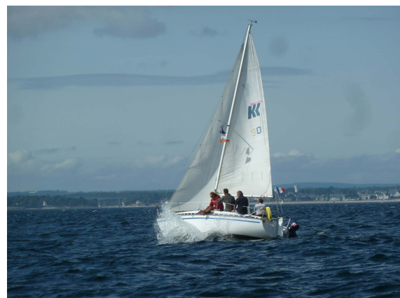
La flaneuse dans la jolie brise du retour