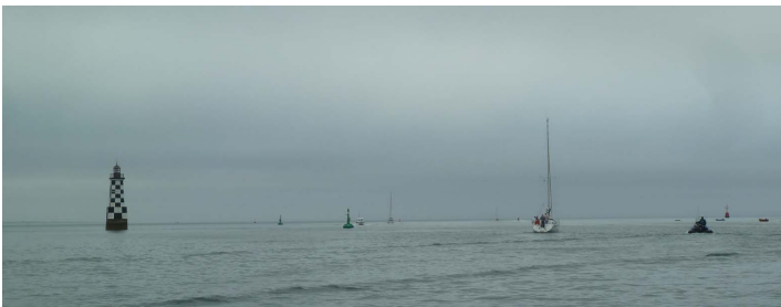
La météo peu engageante au départ de Loctudy