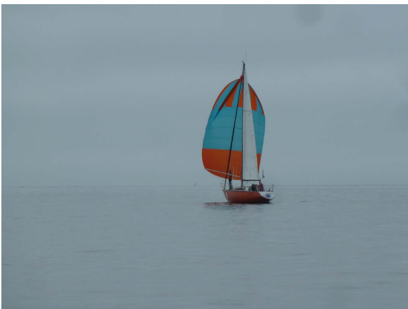
Lorca sous spi dans les petits airs du matin