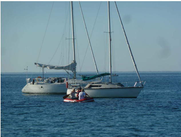
Bérénice et Paprika au mouillage à l'ouest de Penfret