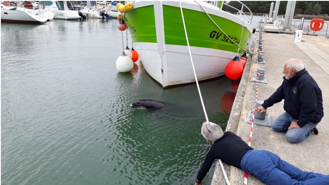
A l'appel de la Sirène

12 octobre : un dauphin dans le port de plaisance de Loctudy !