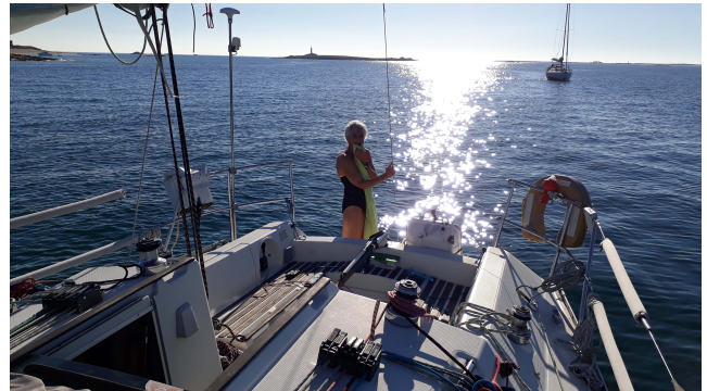
Mais quelle est cette Sirène qui profite de l'été indien?