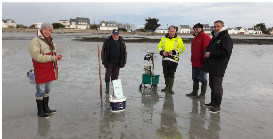
Les pêcheurs l'an dernier au petit matin

Pêche à la palangre de la plage Les 19 et 20 novembre