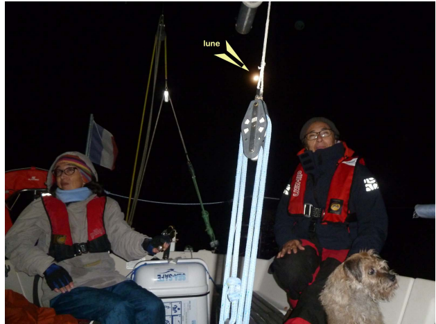
Rêveries au clair de lune