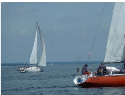
Lorca et Héliantis