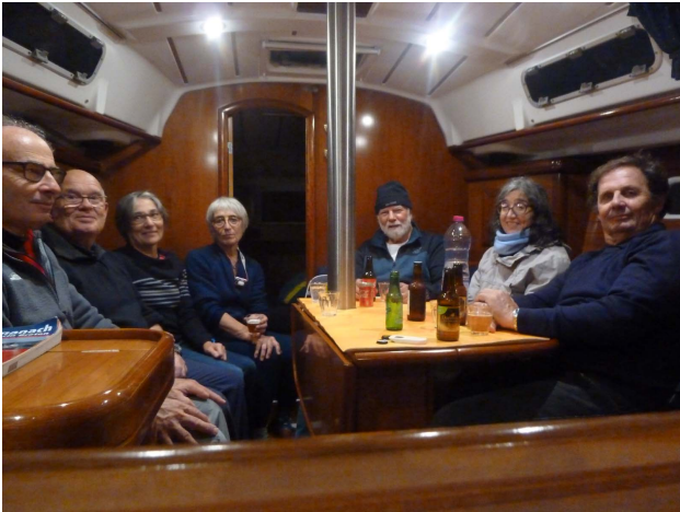
Révision des feux à secteur sur Divine