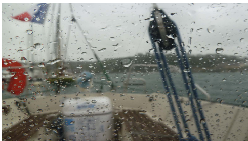
Audierne on n'a pas eu beau, 35 nds de vent