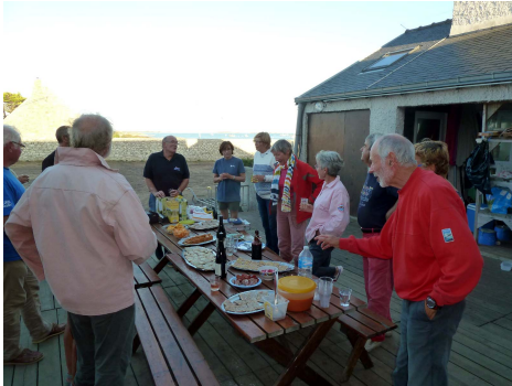
Apéro au gîte du Sextant

Nous avons, comme l'an passé réservé le gîte « Sextant » à Saint Nicolas pour la soirée et la nuit du 4 au 5 septembre, venez nombreux nous rejoindre pour notre barbecue « Glénan » Dès à présent vous pouvez vous inscrire : aploc29@gmail.com