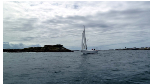
Un ciel qui n'annonce rien de bon... pour le retour