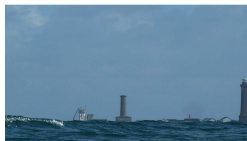
Deux jours après, Il restait de la mer ...