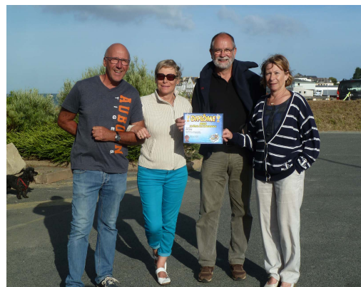
Les lauréats du concours

Le succès d'une belle journée de convivialité clôturée par un sympathique barbecue