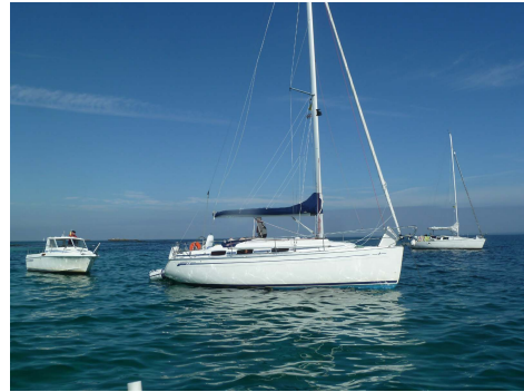
mouillage devant Guiriden