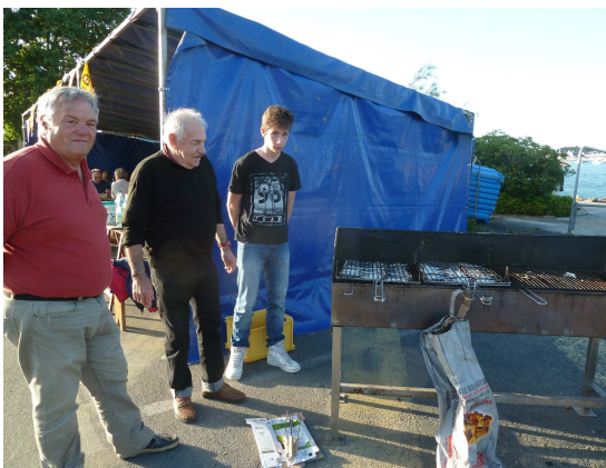
On a même eu des sardines...