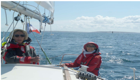
Arrivée à Sein avec la pointe du Raz au fond