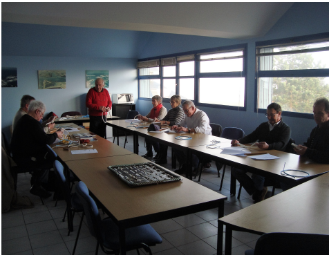
Atelier nœuds du 17 février