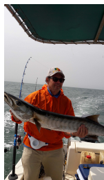
Après on l'appela « Baracuda »