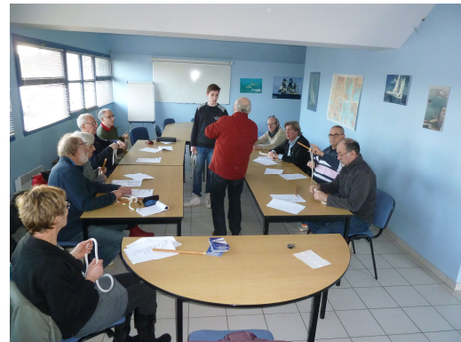
Atelier nœuds du 24 février